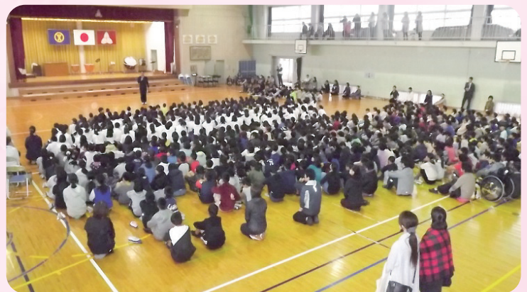
広瀬小学校の全校児童たちが感謝の気持ちを伝える「見守り隊感謝集会」