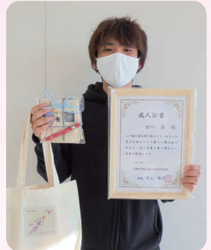
成人式実行委員会より新成人者へ発送配布された記念品等